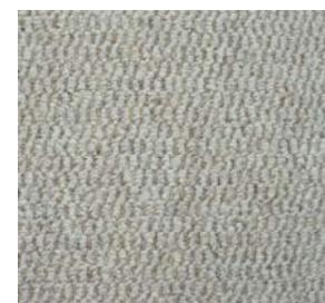
REJOICE - MODÈLE n° 6061

NOTRE NOUVEAU TAPIS BERBÈRE BOUCLÉ. LA BEAUTÉ DE LA SIMPLICITÉ. DOUILLET COMME TOUT POUR LES PIEDS.