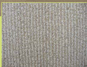
ALGARVE-MODÈLE n° 6458