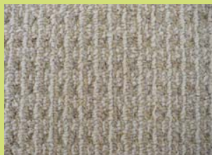
TERANO-MODÈLE n° 6460