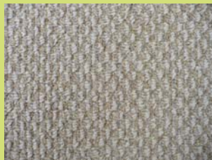
MALTA -MODÈLE n° 6459